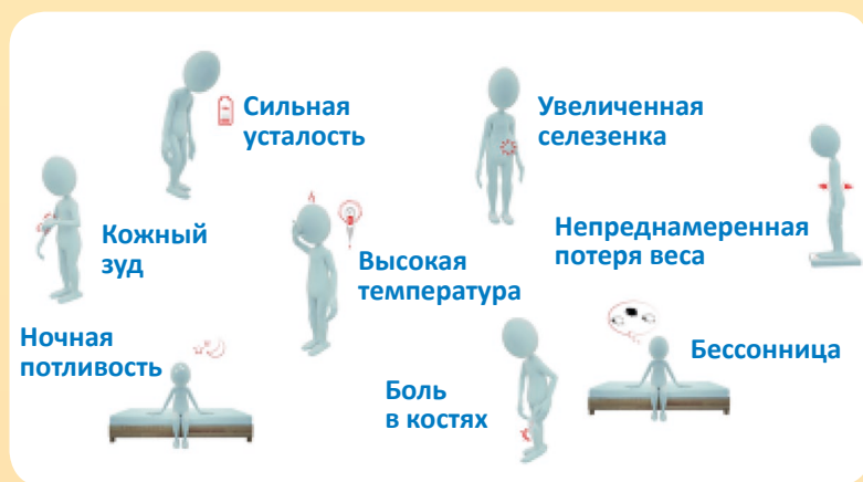
Рисунок 1. Симптомы истинной полицитемии

К основным симптомам, которые могут иметь место при ИП, относятся: слабость, кожный зуд, ночная потливость, боли в костях, тяжесть или боли в левом подреберье (связаны с увеличением селезенки), повышение температуры, потеря веса (рисунки 1).